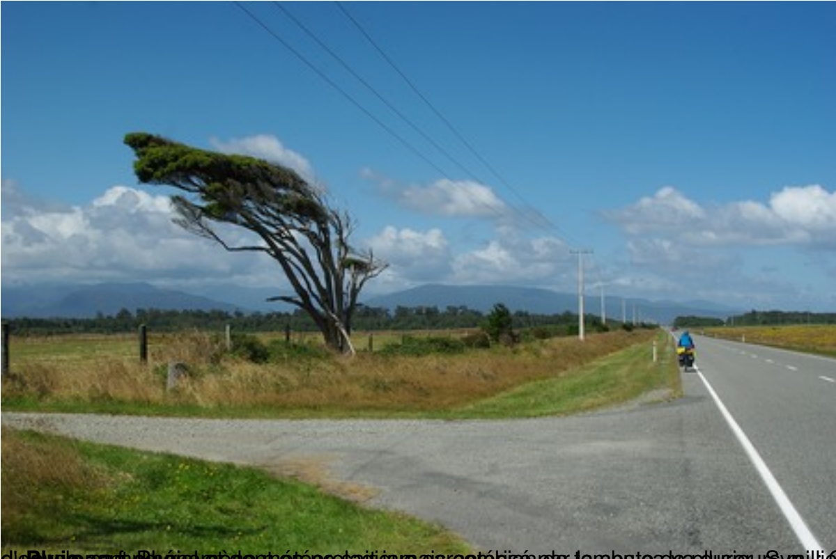
Un tour en vélo ... - Kiwipédia - L'Encyclopédie de Nouvelle Zélande

Écrit par Eric Mardi, 24 Janvier 2012 09:24