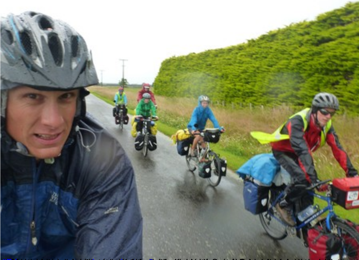
Un tour en vélo ... - Kiwipédia - L'Encyclopédie de Nouvelle Zélande